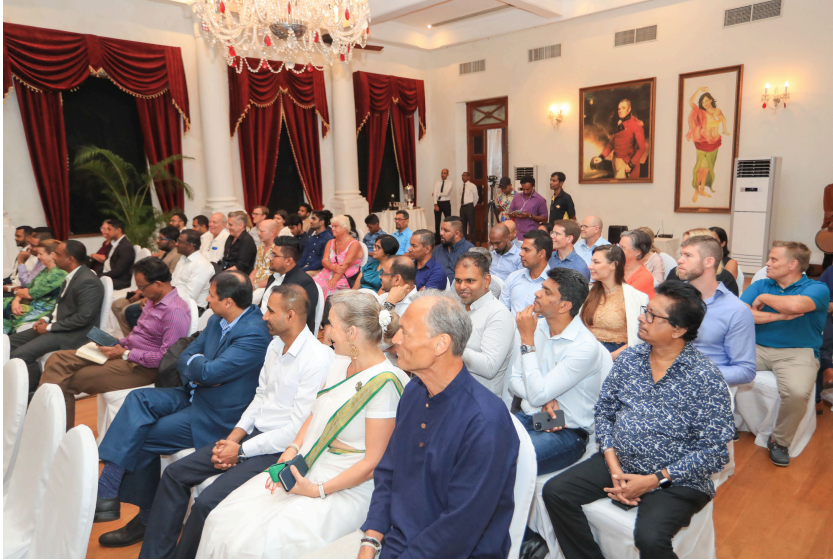
Medlemsmöte i Colomobo 2024