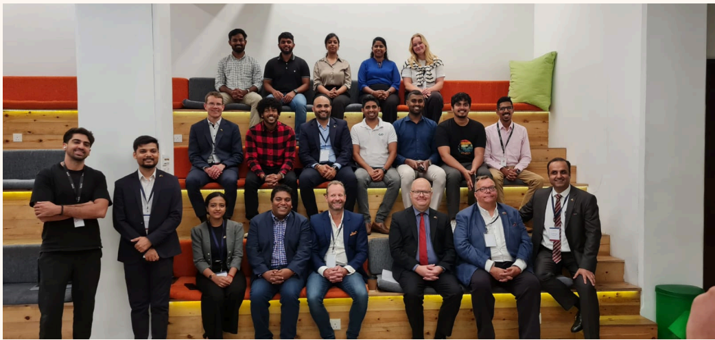
Delegation med Business Sweden - besök hos vår partner Hatch.k