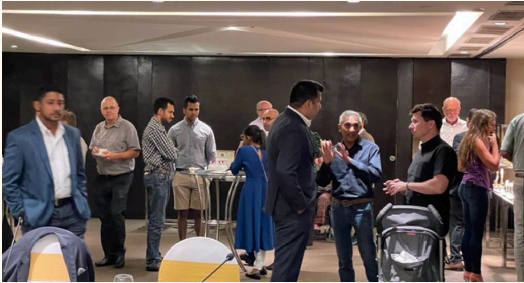
Medlemsmöte i Colomobo 2023